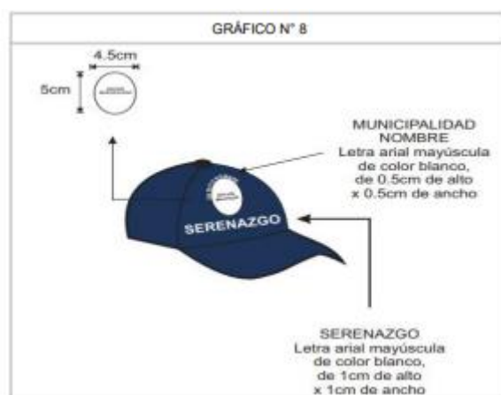
IMAGEN REFERENCIAL GORROS