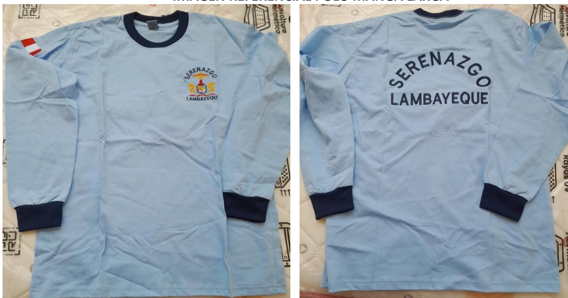
IMAGEN REFERENCIAL POLO MANGA LARGA