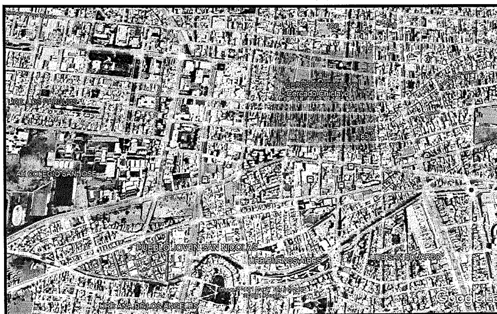
IMAGEN N° 02: Ubicación del área de intervención en el PJ San Nicolás