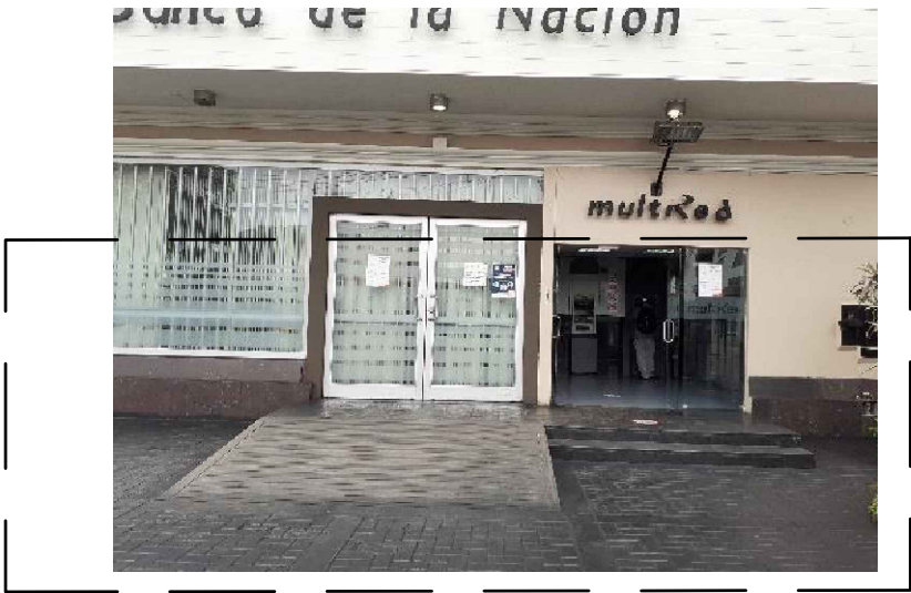
ESTADO ACTUAL - FOTO 1