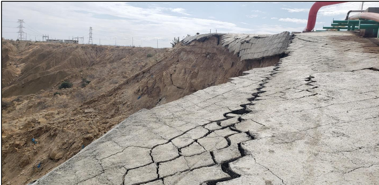
Fotografía 02: “zona de deslizamiento”