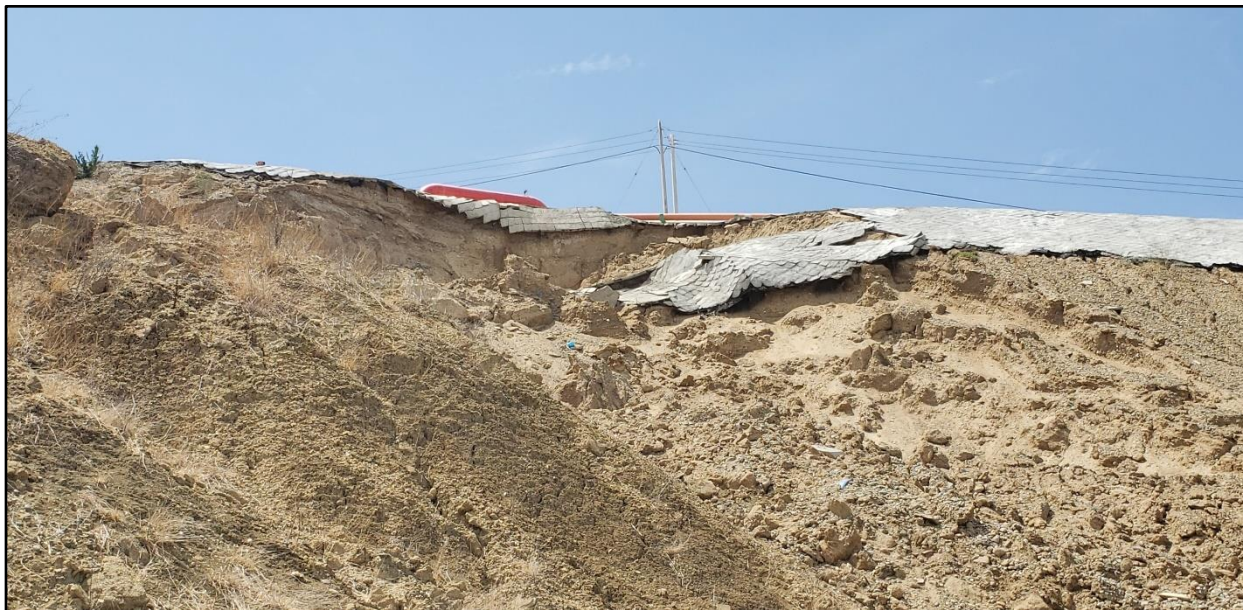
Fotografía 03: “zona de deslizamiento”