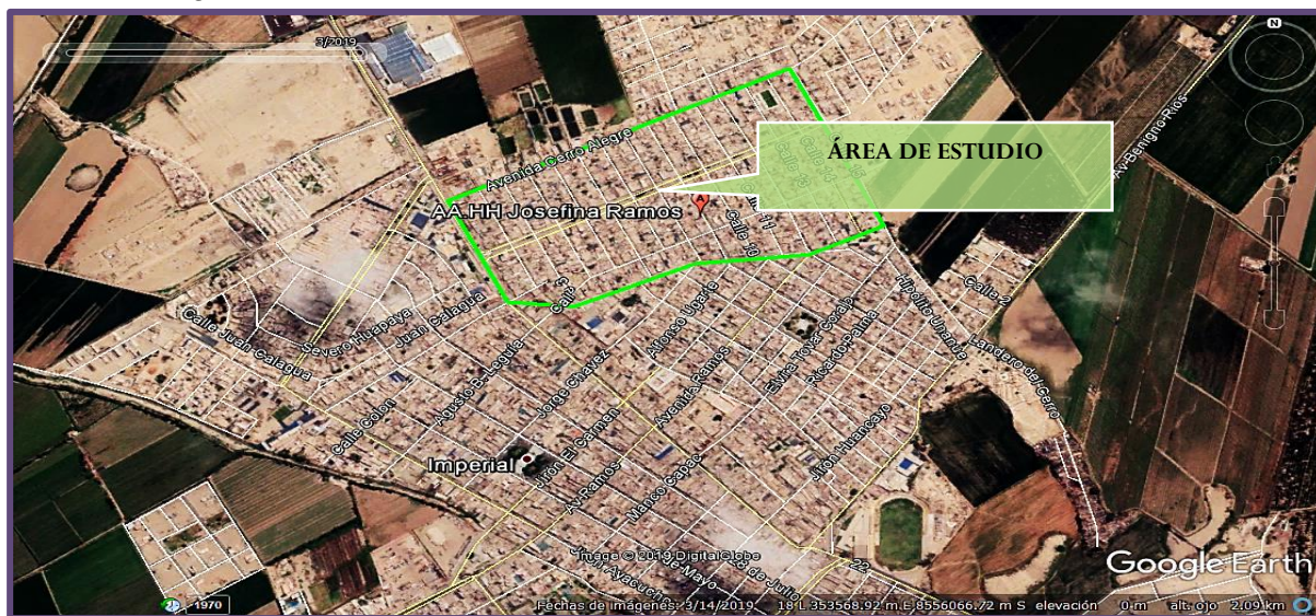
Imagen N°1. Vista Satelital del área de estudio - AA.HH. Josefina Ramos.