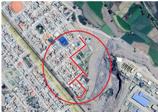
Imagen N° 2: Ubicación del proyecto

El plazo de ejecución de obra es de 120 días calendario.