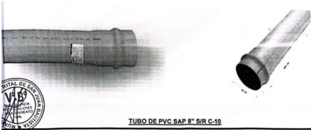
TUBO DE PVC SAP 8" S/R C-10

Características Transporta fluidos. Muy resistente a la abrasión, corrosión y desgaste. Cumple con SN- 2 ISO 4435. Diseñado cuidadosamente de policloruro de vinilo, asegurando una precisa silueta que facilita la fluida transmisión de líquidos. Observaciones Adecuado para agua fría y caliente. Recomendaciones De Uso Transportar con cuidado el material. Instalar con el producto adecuado para obtener una fijación adecuada. Modelo UF S25 Ancho Del Producto 20 cm Color Naranja Temperatura máxima de trabajo 50 °C Presión máxima de trabajo 16 Bar Diámetro nominal 200 mm