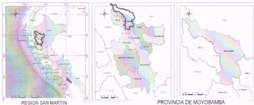
REGION SAN MARTIN