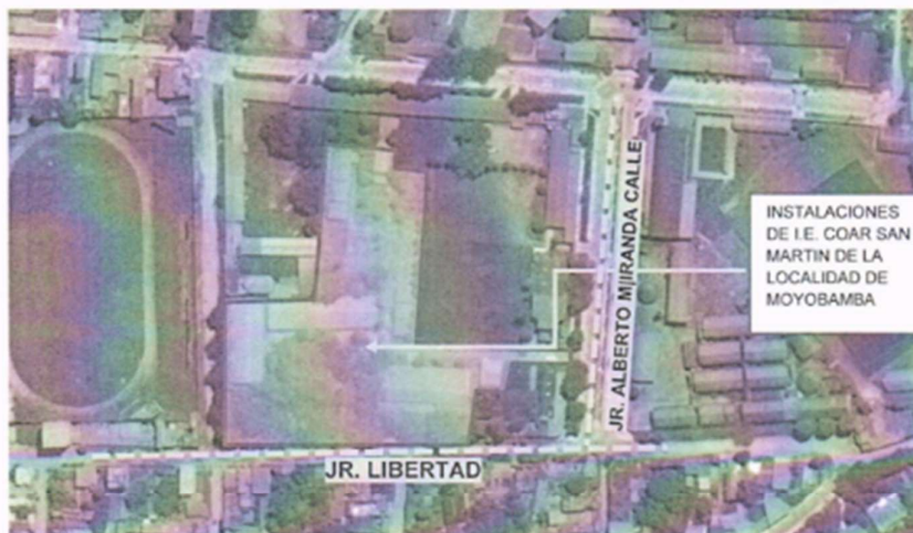
Imagen 2: Mapa de Ubicación satelital

Términos de Referencia de la Contratación de la Ejecución de la obra IOARR: "Reparación de Aula de Educación Secundaria, Ambiente de Residencia, Ambiente de Administración y/o Gestión Pedagógica y Servicios Higiénicos y/o Vestidores, Además de otros Activos en el (la) I.E. COAR San Martín de la Localidad de Moyobamba, Distrito de Moyobamba, Provincia de Moyobamba, Departamento de San Martín" Con CUI N°2576390