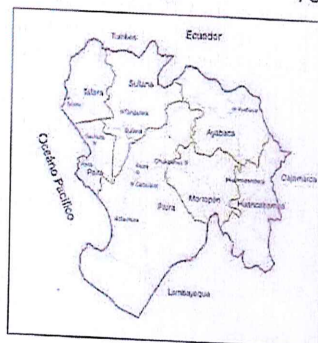
Gráfico 1: Mapa de la Región Piura

Cuenca: : Río Piura Valle : Bajo Piura ALA : Medio y Bajo Piura Sector de Riego : Catacaos Sub Sector de Riego : Seminario