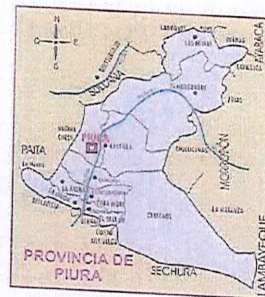
Gráfico 2: Mapa de la Provincia Piura