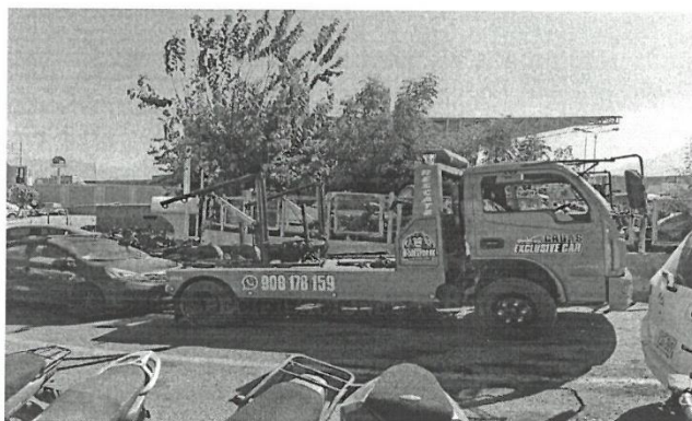
GRUA DE ARRASTRE CON PLATAFORMA PARA TRASLADO DE 04 MOTOCICLETAS CON SU PROPIO SISTEMA HIDRAULICO