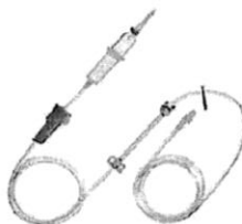
Fig. 1.: Línea para Bomba de Infusión sin Volutrol (No implica diseño)