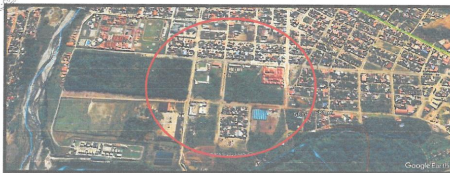
Mapa N° 2 Micro Localización del proyecto