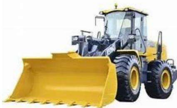
FIG 04 - IMAGEN REFERENCIAL CARGADOR FRONTAL