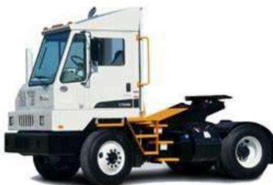
FIG 05 - IMAGEN REFENCIAL TERMINAL TRACK DE 50 TM