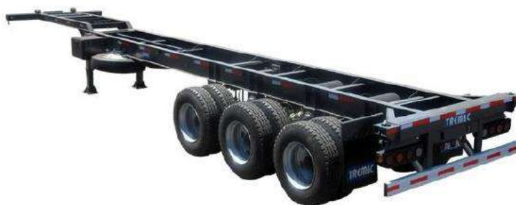
FIG 06 - IMAGEN REFENCIAL CARRETA TIPO PLATAFORMA DE 50 TM