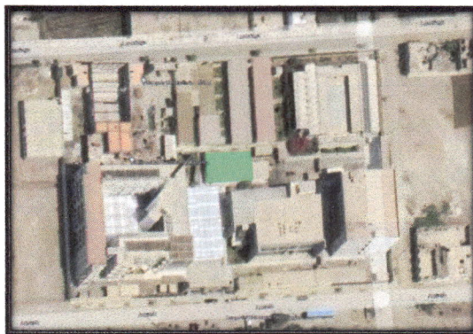
UBICACIÓN DE LA ZONA DEL PROYECTO.

DIRECCIÓN Av. Toribio Luzuriaga N° 376 de la Manzana J. LOCALIDAD Urb. La Florida - Barranca DISTRITO Barranca PROVINCIA Barranca DEPARTAMENTO LIMA REGION LIMA ALTITUD 76 m.s.n.m.