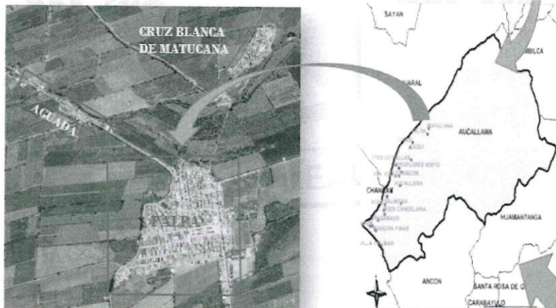
GRÁFICO °02. Micro localización del Proyecto