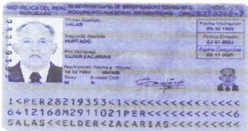
imagen extraída del folio N° S/N°

RESPECTO A LA EMPRESA ELDER Z. SALAS HURTADO Evaluado la propuesta del postor se verifica el DNI EL CUAL ES ILEGIBLE con los datos a favor de ELDER ZACARIAS SALAS HURTADO, identificado con DNI N° NO ES POSIBLE LA VISUALIZACIÓN, a continuación, se muestra imagen del DNI.