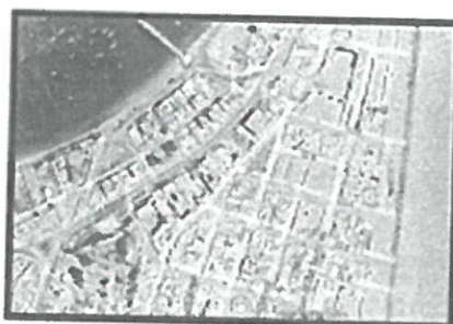
AREA DE INTERVENCION