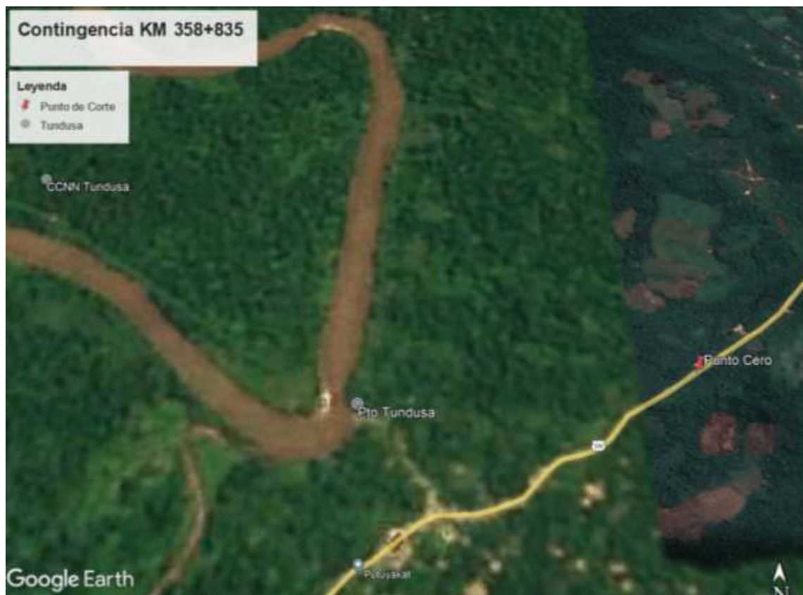
Figura 1. Localización del evento