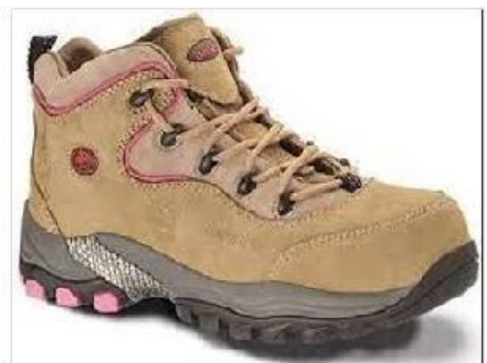
Imagen referencial para damas