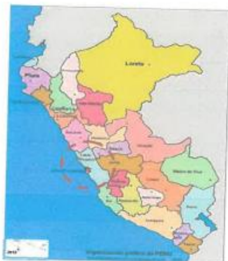
GRAFICO 01: UBICACIÓN NACIONAL

[CONSIGNAR NOMBRE DE LA ENTIDAD] [CONSIGNAR NOMENCLATURA DEL PROCEDIMIENTO]