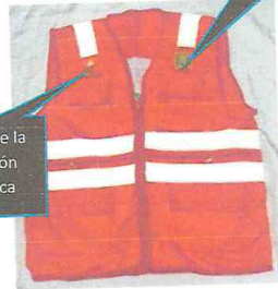
Logo de la Gestión Publica