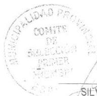
SILVER CHOQUE CCARA PRIMER MIEMBRO TITULAR COMITÉ DE SELECCIÓN