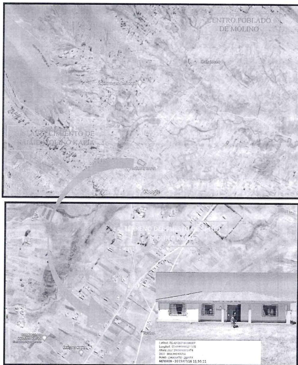
FIGURA N° 01 UBICACIÓN ACTUAL DEL ESTABLECIMIENTO DE SALUD MOLINO KAPIA