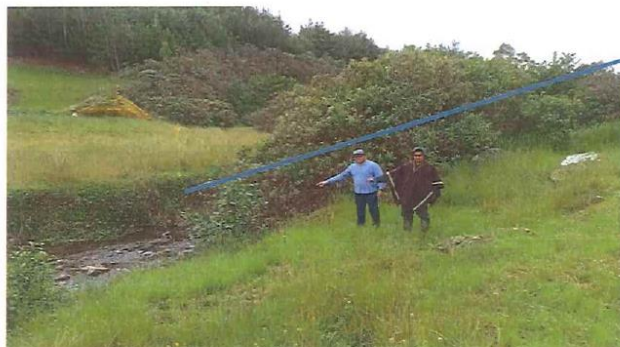
FUENTE DE AGUA DENOMINADA BARRAWTJO