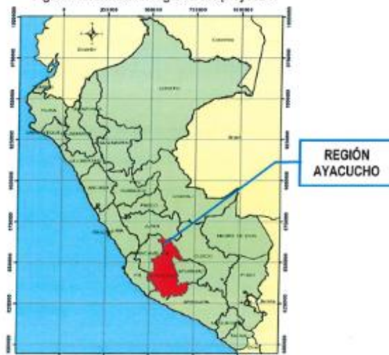
Figura 01. Ubicación regional del proyecto