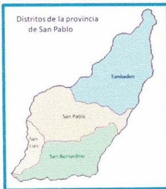
DISTRITO DE TUMBADEN