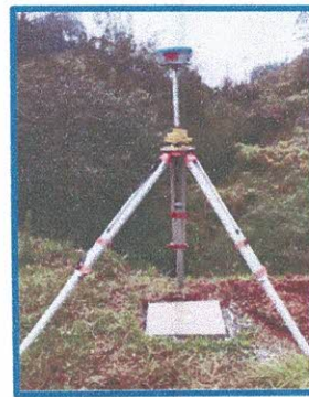
PUENTE EN ÑUÑUELO