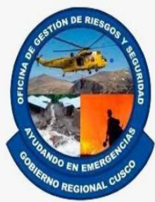
LOGO DEL GOBIERNO REGIONAL DEL CUSCO