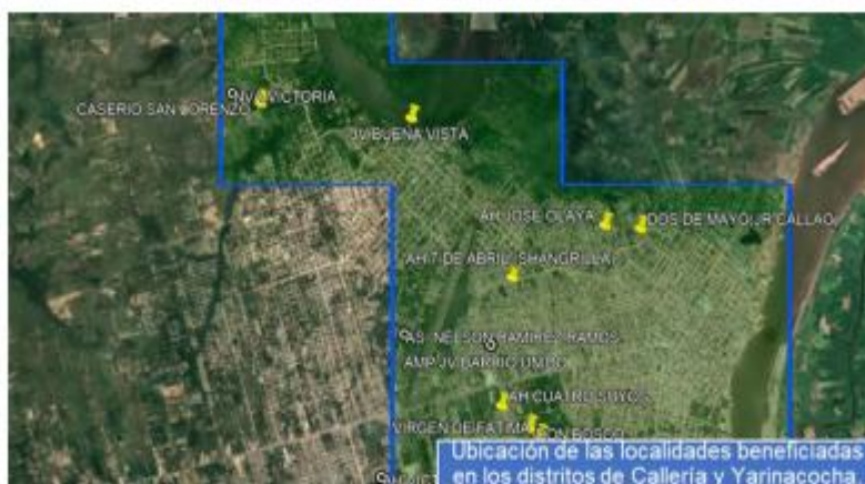
FIGURA N° 02: Área de influencia del Proyecto

El proyecto se encuentra ubicado en los distritos de Yarínacocha, Calleria y Padre Abad, provincia de Coronel y Padre Abad, departamento de Ucayali.