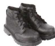
Zapatos de Seguridad con Puntera de Acero