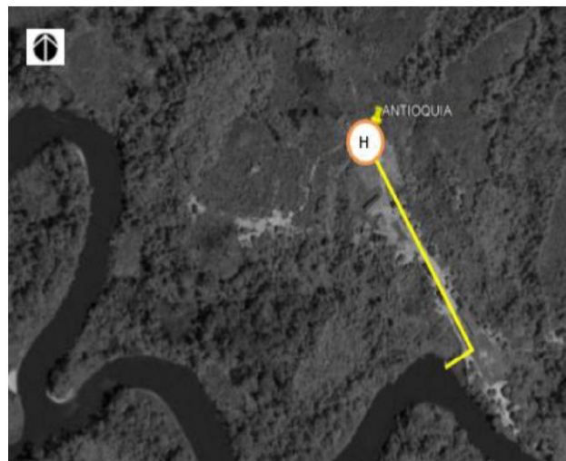
Gráfico: La Vía principal de acceso peatonal se apecia color amarillo y el círculo anaranjado es la ubicación del Puesto de Salud Antioquia.