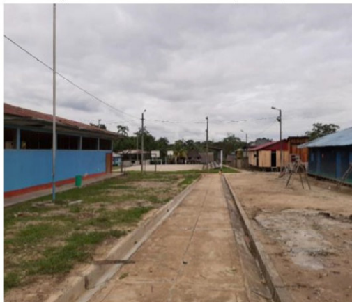
Gráfico: Fotografía de vereda peatonal principal de la Comunidad Nativa de Antioquia

El terreno se encuentra ubicado en la comunidad de Antioquia, no ha habido mejoramiento y asfaltado de vías en estos últimos 10 años, por lo tanto, no existe una accesibilidad más eficiente, encontrarse aproximadamente, a 1000 m del río Corrientes. El entorno inmediato se caracteriza por la conformación de viviendas de material noble y rustico de un nivel, conformado por vías peatonales.