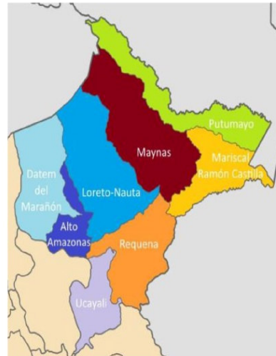
Gráfico: Ubicación de la provincia de Loreto