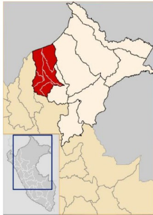
Gráfico: Ubicación del departamento de Loreto