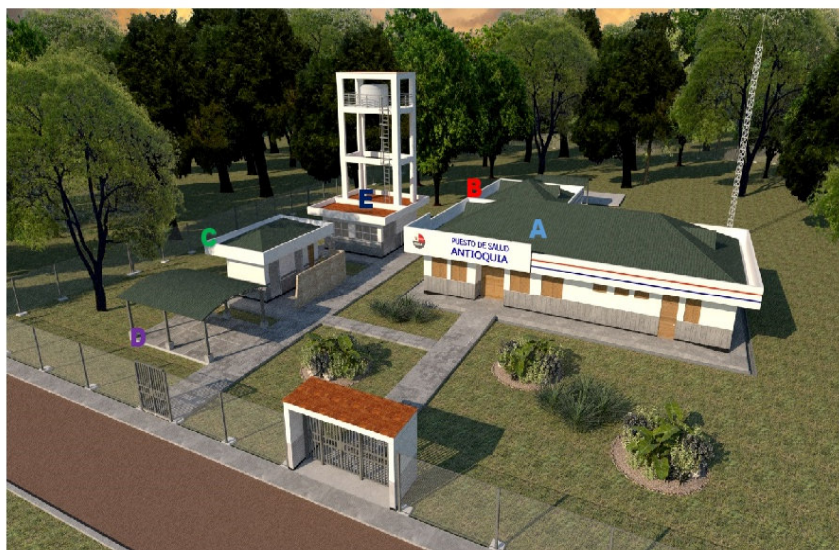
Figura: Vista panorámica, mostrando la zonificación del establecimiento de salud Antioquia

El Proyecto Arquitectónico se ha planteado su ubicación mirando frente al terreno al lado izquierdo del terreno, en el otro extremo del lado derecho del terreno hay una quebrada de escurrimiento de agua con un ancho de 2 metros y además, cruzan cables eléctricos por lo que GORE de Loreto por intermedio de la DIRESA deberán realizar los trámites para el retiro de los cables antes que se inicien las obras