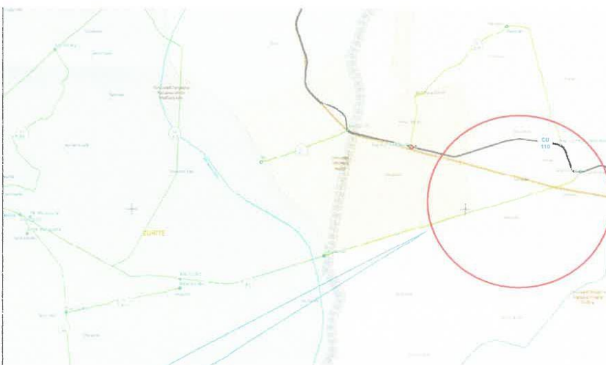
Camino Vecinal. Occoruro - Zurite

El contratista debe cumplir los siguientes requisitos: