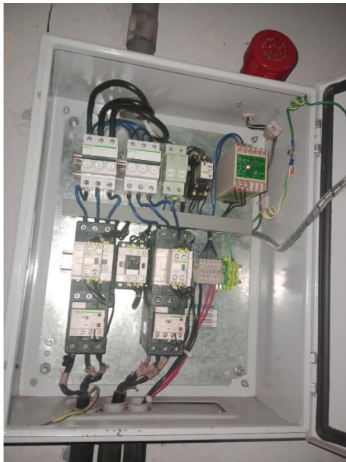
TABLERO DE BOMBAS SUMERGIBLES DE POZO SEPTICO