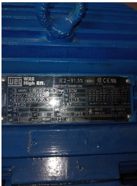
BOMBA N° 02