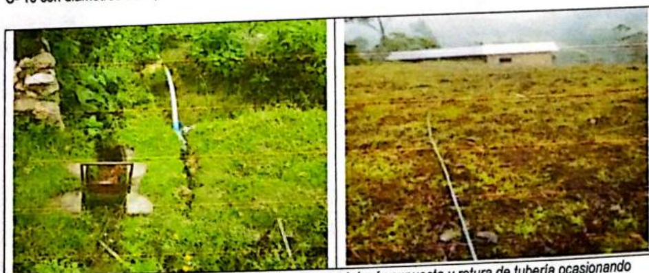
FIG N°05. Línea de conducción y red de distribución con tubería expuesta y rotura de tubería ocasionando que el caudal se pierda. Por tal motivo urge su mejoramiento.

La red de aducción y distribución se encuentra en mal estado con múltiples fugas y expuesta en varios tramos, los desperdicios son mayoritarios dejando a gran parte de la población sin agua. El Material usado son tuberías de PVC C- 10 con diámetros de 1", 3/4".