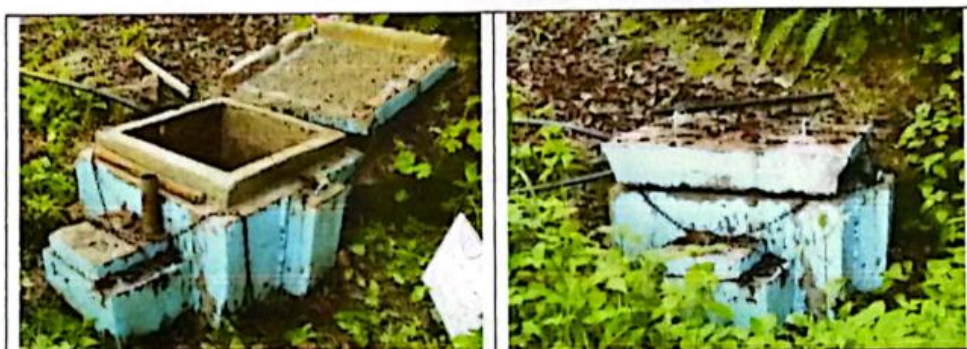
FIG N°13. Captación existente con deterioro en sus estructuras, agrietamiento y erosión del concreto, originando que el caudal se pierda por filtraciones de agua.