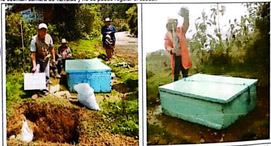
FIG N°07. Cámaras rompe presión en mal estado con tapas oxidadas y paredes erosionadas por el tiempo. Urge su mejoramiento.

Los cámaras rompen presión existentes son de concreto simple; se encuentran con tapas de concreto deterioradas, no cuentan cámara de válvulas y no se puede regular el caudal.