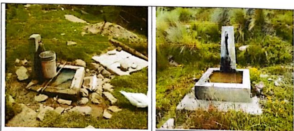
FIG N°12. Piletas y conexiones domiciliarias en mal estado, descubiertas, rotas, con las llaves en mal estado. El agua no puede ser controlada, perjudicando para los pobladores.

El número actual de beneficiarios del sistema de agua potable en los caseríos La Esperanza y Pampa Grande son de 77 viviendas. Con el nuevo proyecto estas piletas quedaran sin uso.