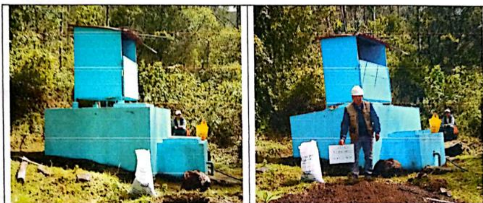
FIG N°06. Reservorio rectangular existente con deterioro en sus estructuras, presentando agrietamiento y erosión del concreto. Urge su mejoramiento.

Se proyecta realizar la construcción del reservorio debido a los daños que presenta el reservorio existente tanto estructuralmente como hidráulicamente.