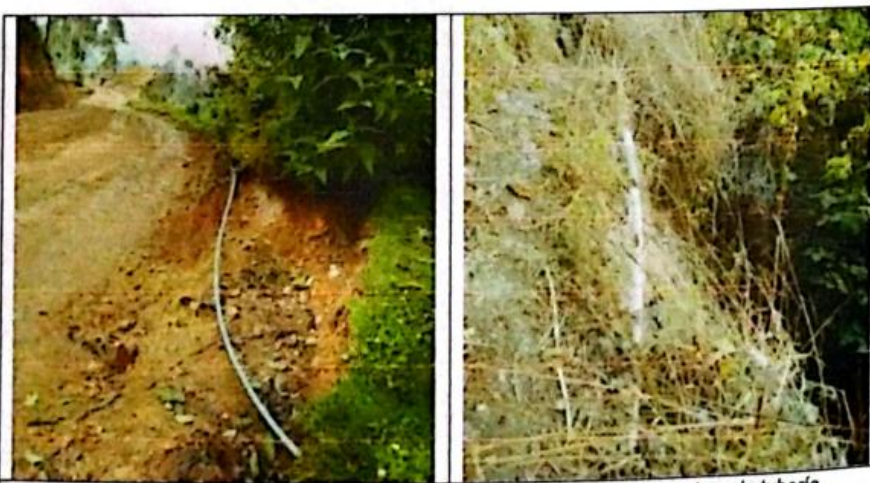
FIG N°10. Línea de conducción y red de distribución con tubería expuesta y rotura de tubería ocasionando que el caudal se pierda. Por tal motivo urge su mejoramiento.