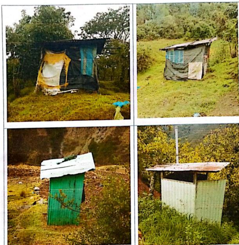
FIG N°16. Letrinas construidas de manera rustica por los pobladores, se encuentran en mal estado, sin ningún tipo de mantenimiento, las letrinas de hoyo seco han sobrepasado su capacidad. Urge su mejoramiento.