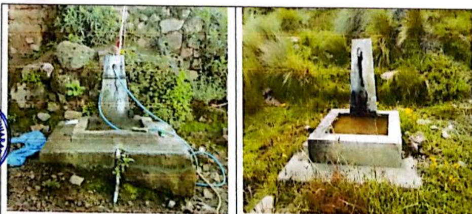
FIG N°17. Piletas y conexiones domiciliarias en mal estado, descubiertas, rotas, con las llaves en mal estado. El agua no puede ser controlada, perjudicando para los pobladores.

Las intervenciones realizadas en los caseríos La Quida, la Esperanza, Pampa Grande y La Tuna, solo han sido realizadas únicamente en el mejoramiento del sistema del agua potable, no existe intervención en saneamiento básico, las letrinas han sido construidas por los pobladores sin ningún tipo de asistencia técnica y han sido realizadas con materiales de la zona, como se puede observar en las imágenes siguientes: