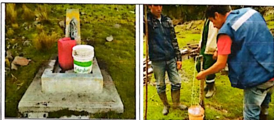
FIG N°08. Piletas y conexiones domiciliarias en mal estado, descubiertas, rotas, con las llaves en mal estado. El agua no puede ser controlada, perjudicando para los pobladores.

El número actual de beneficiarios del sistema de agua potable en este caserío son de 17 viviendas y 01 conexión domiciliar para la Institución educativa nivel primario. Con el nuevo proyecto estas piletas quedaran sin uso.