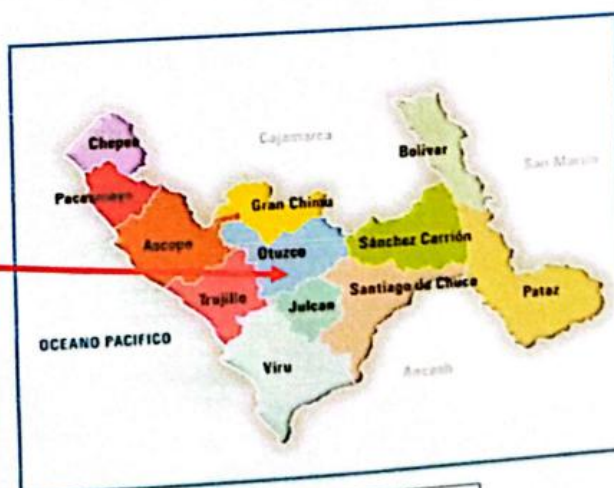
MAPA POLITICO DE LA LIBERTAD