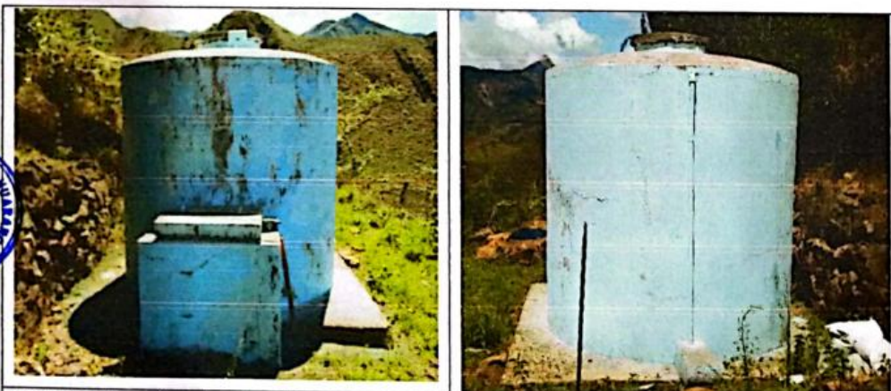
FIG N°15. Reservorio rectangular existente con deterioro en sus estructuras, presentando agrietamiento y erosión del concreto. Urge su mejoramiento.

Los cámaras rompen presión existentes son de concreto simple; se encuentran con tapas de concreto deterioradas, no cuentan cámara de válvulas y no se puede regular el caudal.