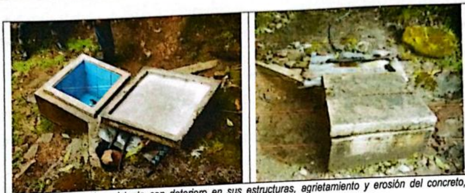
FIG N°04. Captación existente con deterioro en sus estructuras, agrietamiento y erosión del concreto, originando que el caudal se pierda por filtraciones de agua.

La línea de conducción existente es de PVC C-10 de 1" de diámetro, la tubería presenta alto grado de deterioro por lo expuesto en la que se encuentra en gran parte de los tramos y por el arrastre de sedimentos en su interior al no contar el agua captada con ningún tipo de mantenimiento se encuentran tramos con rotura ocasionando fugas de agua y en otros tramos la tubería se encuentra expuesta debido a la erosión del suelo y a deslizamientos de tierra en ciertas zonas.