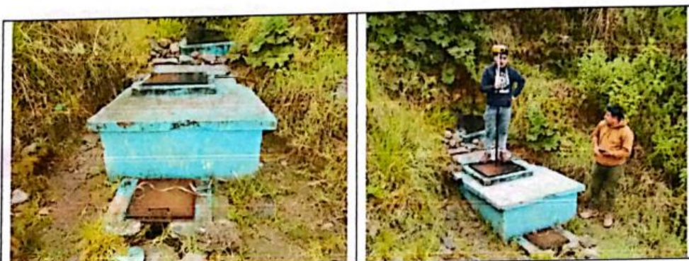
FIG N°09. Captación existente con deterioro en sus estructuras, agrietamiento y erosión del concreto, originando que el caudal se pierda por filtraciones de agua.

Se proyecta hacer la construcción de la captación debido a los daños que presenta la captación existente tanto estructuralmente como hidráulicamente.