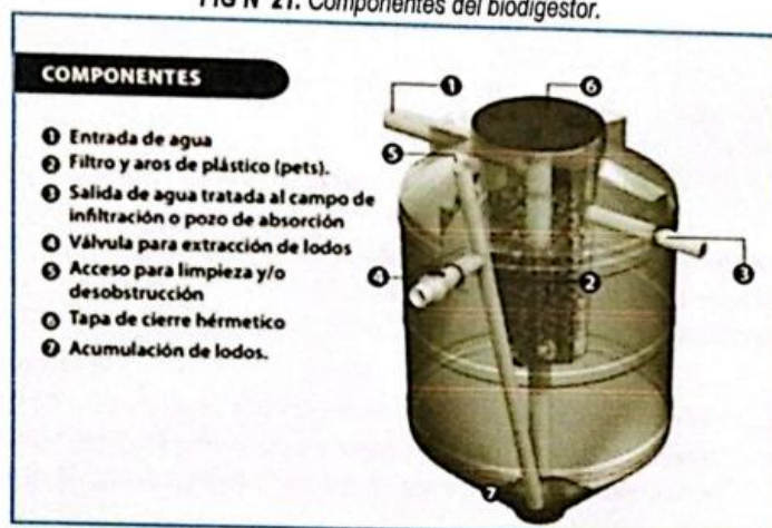
FIG N° 21. Componentes del biodigestor.