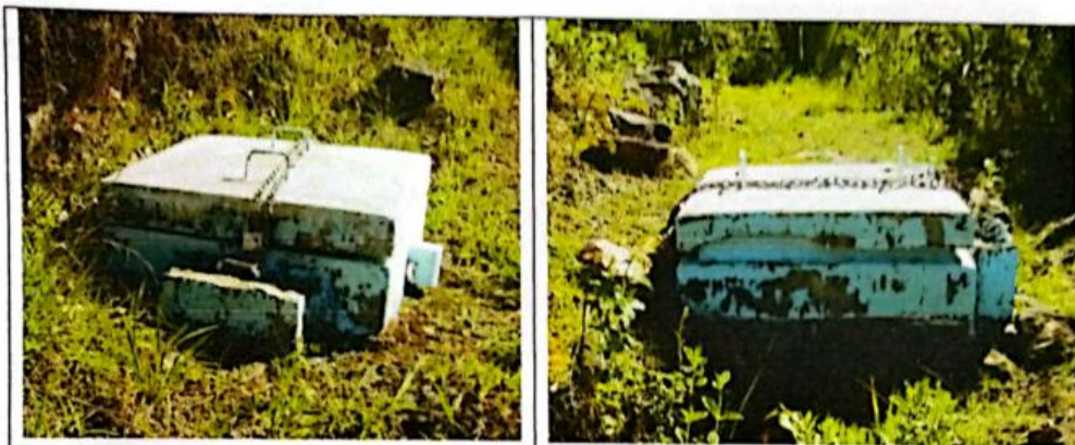
FIG N°16. Cámaras rompe presión en mal estado con tapas oxidadas y paredes erosionadas por el tiempo. Urge su mejoramiento.

Las conexiones domiciliarias en la localidad de La Tuna, se encuentran en pésimas condiciones, no cuenta con lavaderos, el resto de la población se abastece a través de piletas públicas y acarreo de agua a través de baldes. Las piletas existentes son de concreto simple y accesorios de PVC; gran parte están en mal estado, lo cual ocasiona el desperdicio del agua.