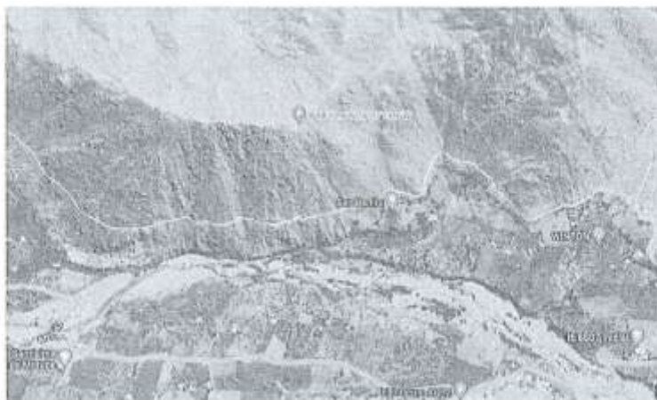
Vista del Área de Intervención del Proyecto