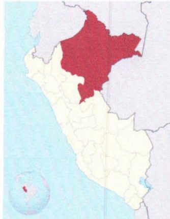
UBICACIÓN DE LA REGION LORETO