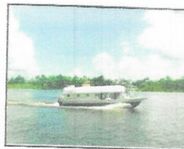
MOTONAVE (RAPIDO - EXPRESO)