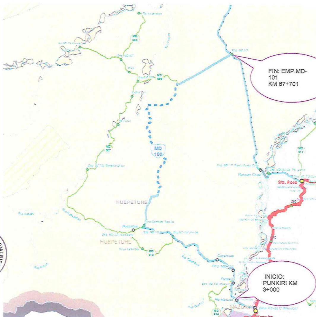
IMAGEN 02: Trayectoria del Camino Departamental (Tramo a Intervenir)