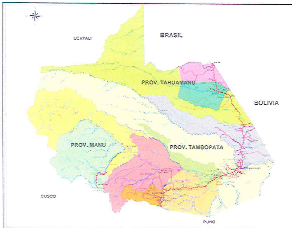
IMAGEN 01: Mapa de Ubicación del Camino Departamental (Tramo a intervenir)