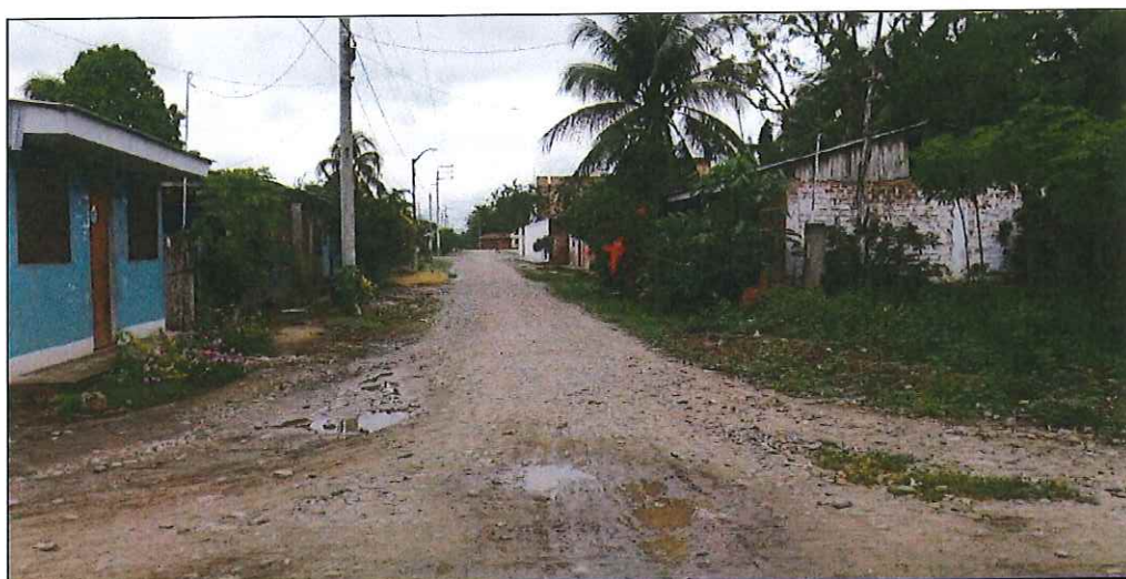
Jr. Sargento Lores C-02, en el cual no existe sistema de drenaje pluvial, siendo necesario su ejecución, se proyecta cunetas y alcantarillas