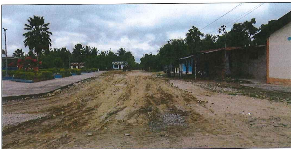
Jr. Alfonso Ugarte C-02, en el cual no existe sistema de drenaje pluvial, siendo necesario su ejecución, se proyecta cunetas y alcantarillas