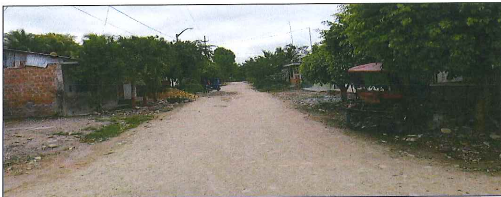
Jr. Bolognesi C-01, en el cual no existe sistema de drenaje pluvial, siendo necesario su ejecución, se proyecta cunetas y alcantarillas.

A continuación, se presentan fotografías con las características del cauce que está operando actualmente: