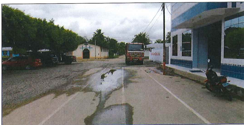
Jr. Lima C-03, en el cual no existe sistema de drenaje pluvial, siendo necesario su ejecución, se proyecta cunetas y alcantarillas