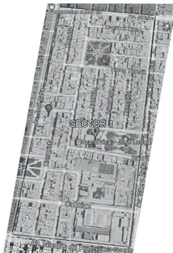
FIGURA 9.2. Mapa de Micro localización del Área del Proyecto