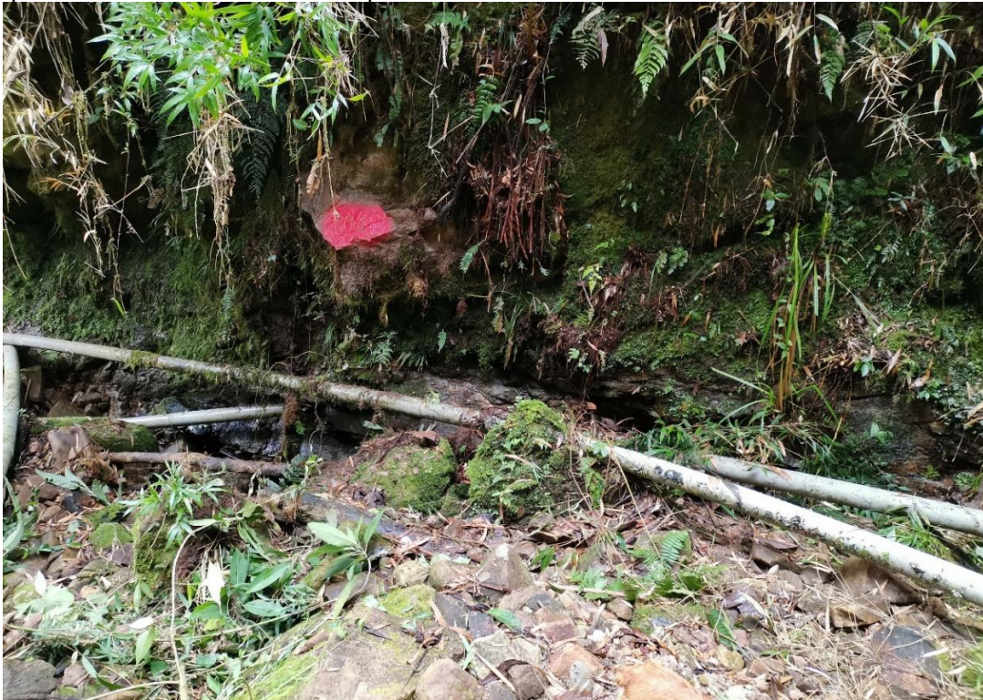
Imagen N°04: En esta imagen observamos la tubería a la intemperie en el KM: 0+101.469 – 1+107.237, con una longitud de 5.768m, sobre la quebrada denominada “SANTA ROSA”. No existe estructura de pase, como se muestra en la foto que la tubería forma un arco por su propio peso con riesgo de ruptura, en el cual se debe proyectar un Pase Aéreo N°02 (L=8.00m).

mantenimiento del este sistema de riego. El tipo de tubería de todo el tramo de conducción que respecta a una longitud total de 1674m es PVC-U NTP 399.002:2009 Ø=4". En todo el tramo encontramos 3 tipos de codos de PVC: Codo de 45°, 22.5° y 11.25°, 03 TEE de 4" con reducción a 2 1/2", 3 hidrantes de concreto a demoler con válvulas de compuerta de bronce. No se encontraron ninguna obra de arte de cruce de tubería como pases aéreos en quebradas o acequias es por eso que solo se encuentran a la intemperie en todos estos casos.