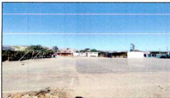
Foto N°01: Vista Panorámica de Losa Existente que se Encuentra en Mal Estado.