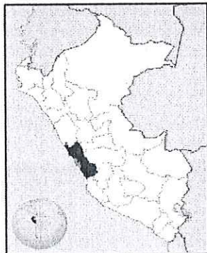
UBICACIÓN GEOGRÁFICA DEL DEPARTAMENTO DE LIMA

Región : Lima Departamento : Lima Provincia : Lima Distrito : Lince