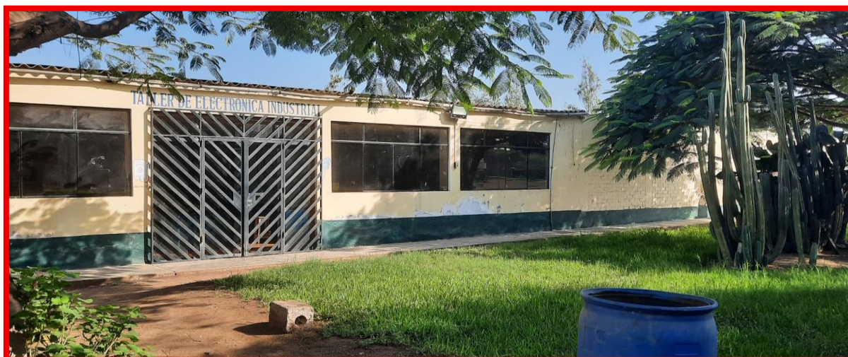
Imagen N° 05- vista frontal de taller electrónica industrial