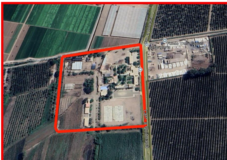
(Instituto de Educación Superior Tecnológico Cañete) – Quilmana