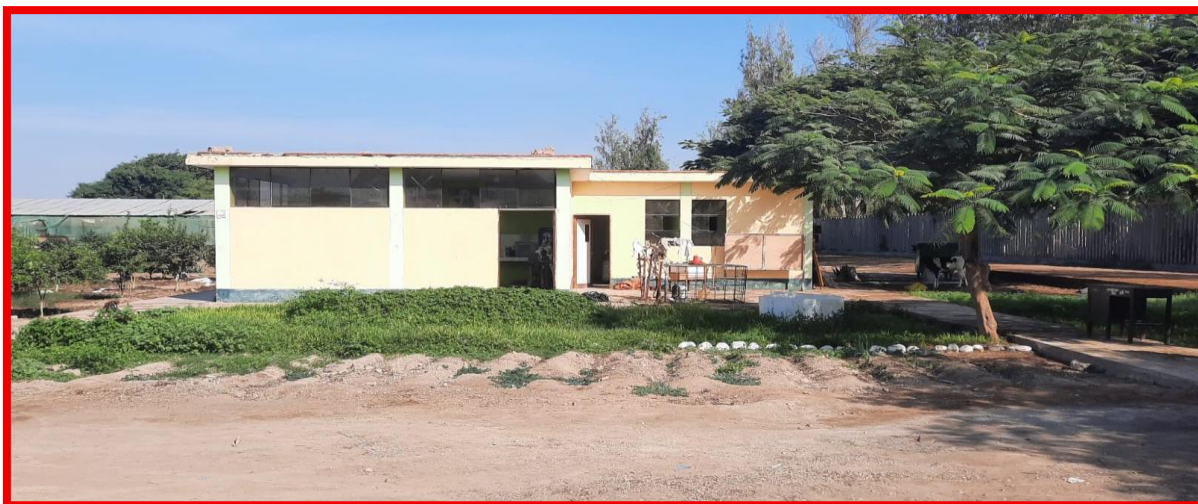
Imagen N° 06- vista frontal de laboratorio de veterinaria