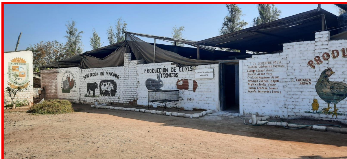
Imagen N° 03- vista frontal de galpones menores