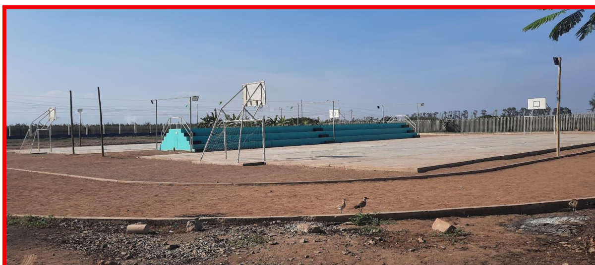
Imagen N° 02- vista losa deportiva existente