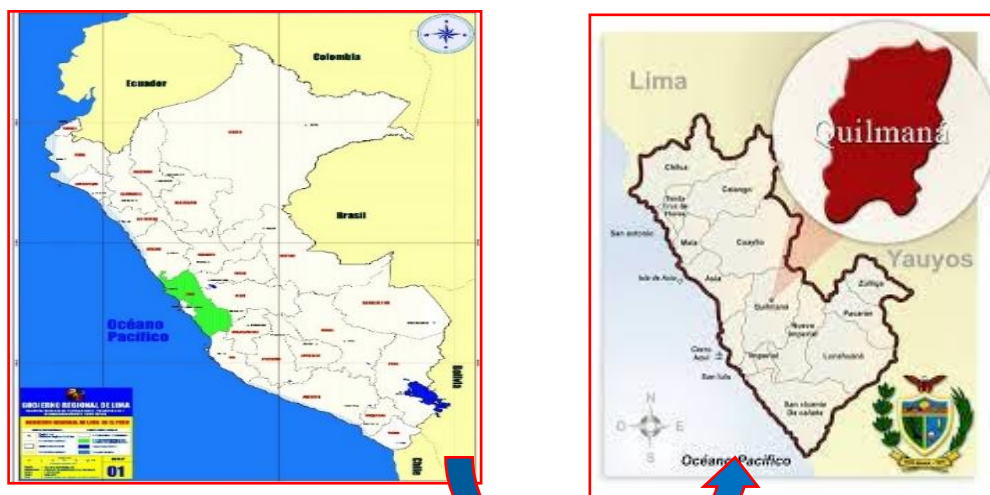
Imagen N° 01: Ubicación del Proyecto

Departamento : Lima Provincia : Cañete Distrito : Quilmana Sector : INSTITUTO TECNOLOGICO PUBLICO DE CAÑETE