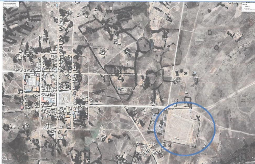
Mapa N° 2: Ubicación del Estadio de Huanaspampa