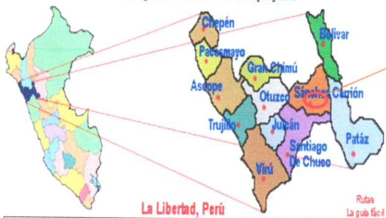
Imagen N° 1. Ubicación del proyecto

Provincia de Sánchez Carrión en la Región La Libertad