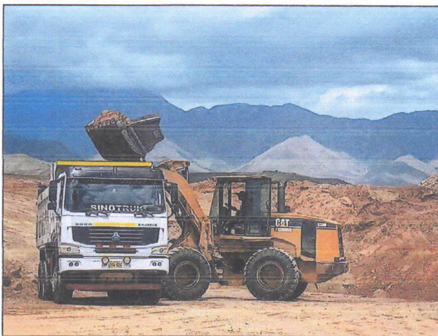
Foto N° 03: Carga de material de relleno - Zona: Cantera Vinchamarca - Día: 20/04/2023.