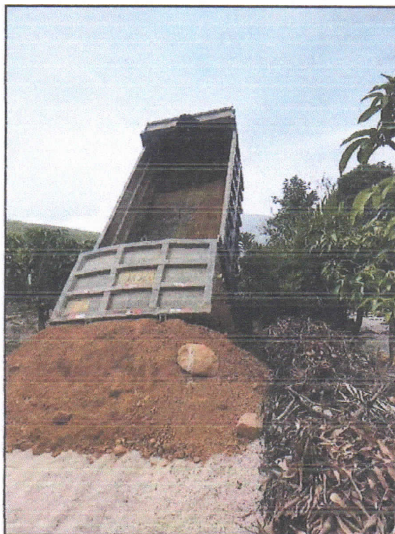
Foto N° 04: Descarga de material de relleno - Zona: Caserío Quillhuay - Día: 19/04/2023.