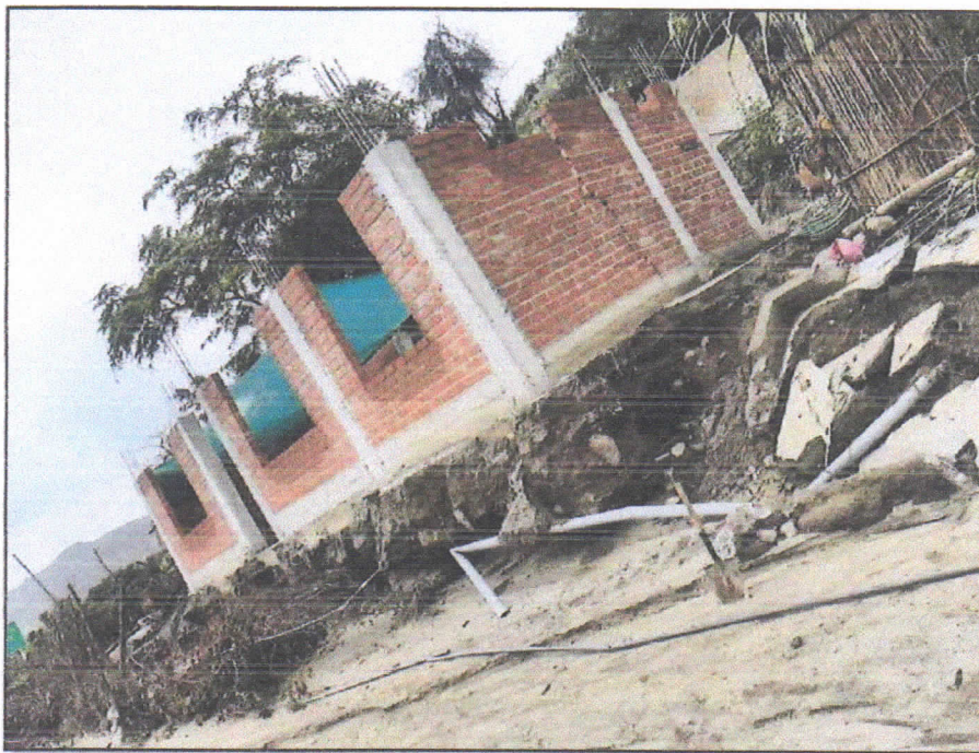
Foto N° 02: Vía vecinal Quillhuay - Zona: Caserío Quillhuay - Día: 08/04/2023.