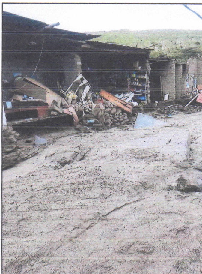
Foto N° 01: Vía vecinal Quillhuay - Zona: Caserío Quillhuay - Día: 08/04/2023.

El día 06 de abril del 2023, las intensas lluvias provocaron la activación de la Quebrada que atraviesa en caserío de Quillhuay, lo que produjo el deslizamiento de grandes volúmenes de arena que colmataron la vía principal y accesos en el caserío; todo esto dificulta el tránsito de vehículos menores y mayores, puesto que, el terreno se vuelve inestable y puede provocar accidentes. La vía anteriormente mencionada, se encuentra arenada lo que imposibilita el tránsito de todo tipo de vehículos.