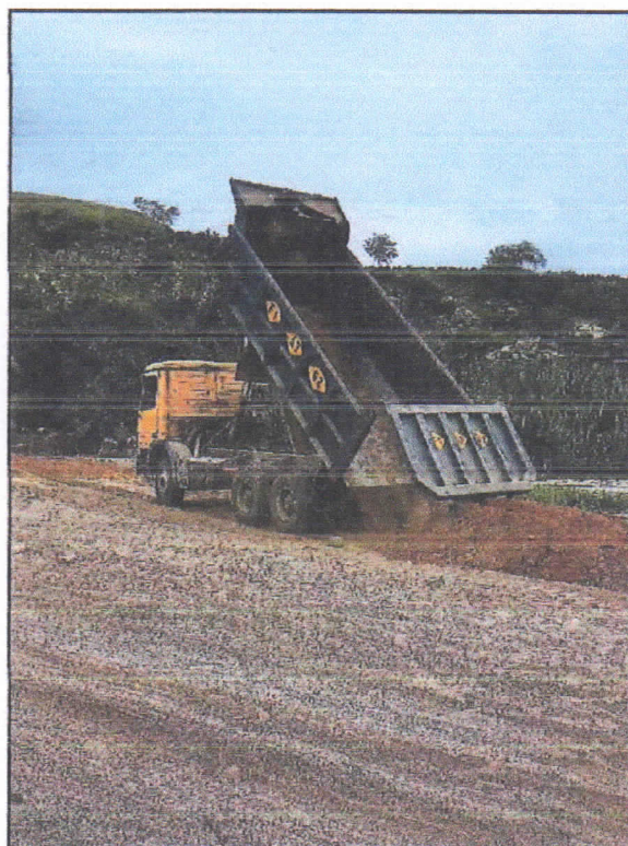
Foto N° 05: Descarga de material - Zona: Caserío Quillhuay - Día: 21/04/2023.