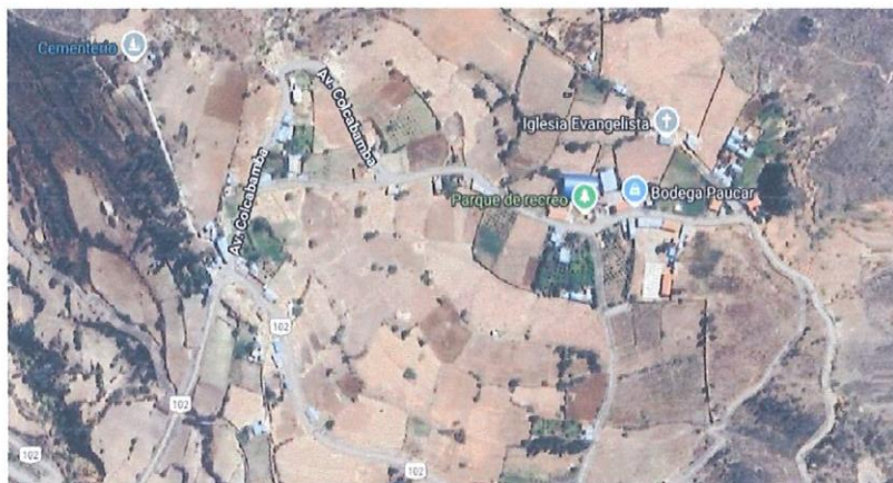
Lugar del proyecto.

El acceso a la localidad de Colcabamba desde la ciudad de Huaraz, se encuentra descrita según el cuadro que a continuación se detalla: