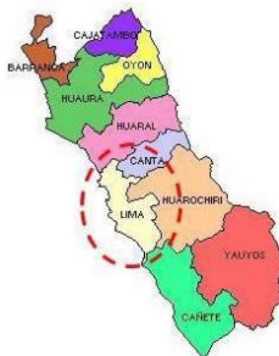
Provincia de Lima