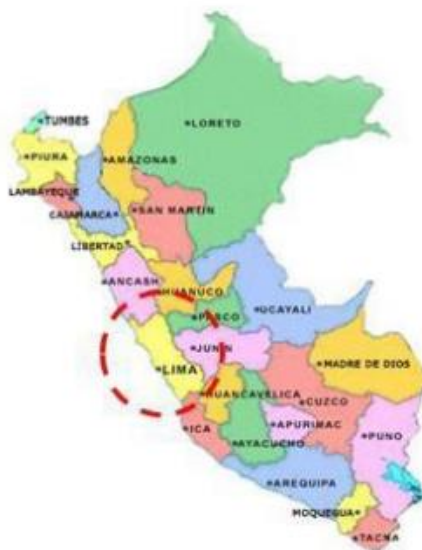
Departamento de Lima