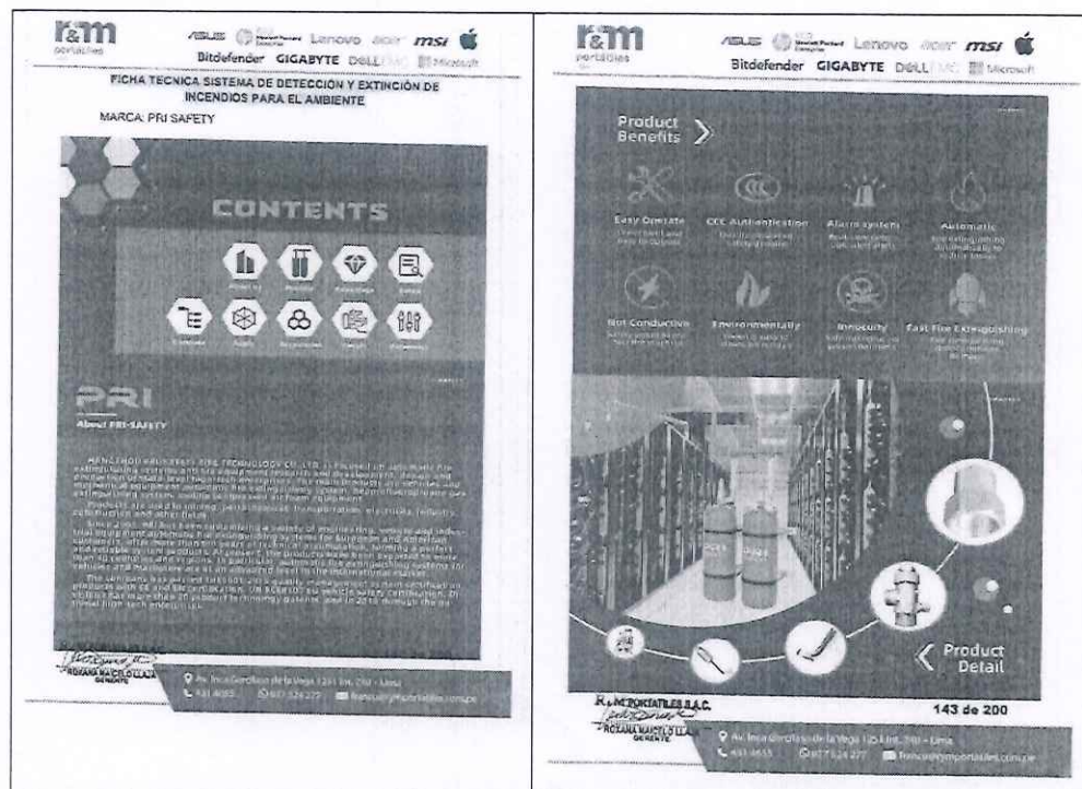
Extraído de los folios 142 y 143 de la Oferta

De la revisión integral de los documentos presentados por el postor R & M PORTATILES SOCIEDAD ANONIMA CERRADA se aprecia los documentos de presentación obligatoria, los cuales fueron revisados por los miembros del Comité de Selección señalando que el postor presenta Ficha Técnica (Folio 142 al 148) en donde se indica NO CUMPLE con acreditar lo solicitado en el literal e) del numeral 2.2.1.1, toda vez que de conformidad con el Expediente Técnico rubro MECANICAS, numeral 2.3 indica que el sistema mencionado es el encargado de liberar el gas extintor por agente limpio Novec 1230 una vez que se ha confirmado el incidente de incendio por el sistema de detección de incendios por aspiración temprana. Así también, del Expediente Técnico se aprecia en las Consideraciones Técnica del mismo sistema, el agente de extinción debe ser NOVEC 1230.