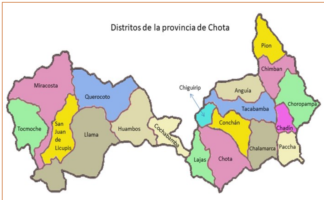
Imagen 03: Ubicación de la localidad de Colpatuapampa